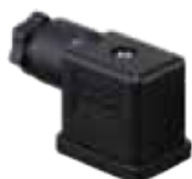
DIN 43650 - Industrial Standard B 11mm