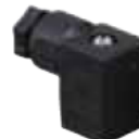
MICRO DIN 43650-Industrial Standard C 9.4 mm