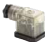
DIN 43650 - Industrial Standard B 11mm LED 24V/230V