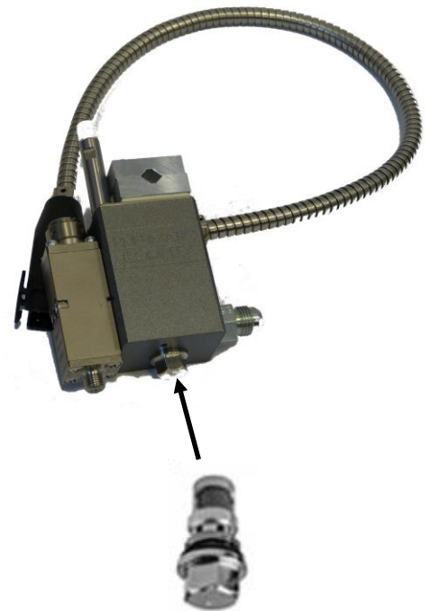
Filtr kleju wbudowany w głowicę